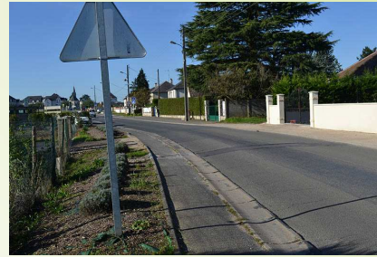
Un espace public peu qualitatif