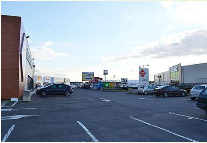
La place omniprésente des voitures