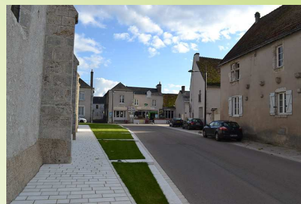
Centre de Montlivault

Les atouts paysagers sont nombreux et témoignent du lien très fort entre l'homme et son environnement. Enfin, les enjeux de protection, d'entretien et de valorisation sont majeurs.