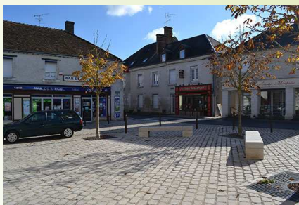
Place de l'église à Mont-Près-Chambord