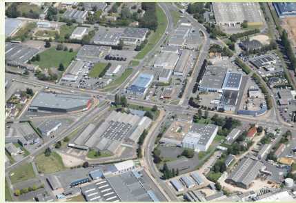
Perte et imperméabilisation des sols