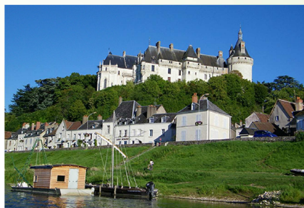
Le Château et le village de Chaumont-sur-Loire.