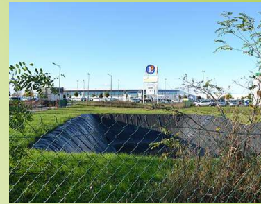
Bassin d'eau pluviale peu qualitatif