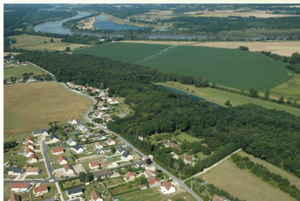
Extensions pavillonnaires à proximité de la Loire

Pour les futures zones d'habitat, l'enjeu est de réussir à ce que les nouveaux quartiers prennent en compte les spécificités paysagères de la commune .