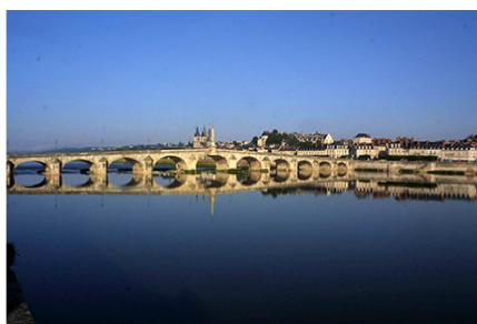
Blois vue depuis la rive gauche

La rive droite de Blois vue depuis la rive gauche, le château de Ménars vu depuis la rive opposée, les châteaux de Chaumont-sur-Loire, Chambord, Blois, Cheverny forment des paysages de carte postale : ils sont les pilliers de l'identité du territoire et imprègnent l'imaginaire collectif . Dans ce sens ils structurent le territoire et sont facteurs d'attractivité tant vis-à-vis des touristes que des nouveaux habitants. De ce fait, la prise en compte des co-visibilités est majeure pour tout projet de développement proche de ces sites.