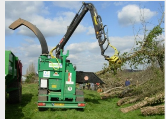
La filière bois-énergie