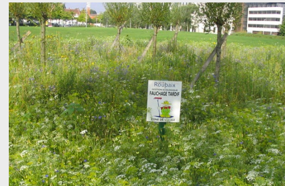
Exemple de gestion différenciée: la fauche tardive