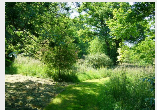
Sentier nature en ville – valorisation des vergers