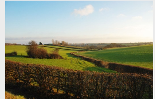
Haies participant à l'identité du territoire